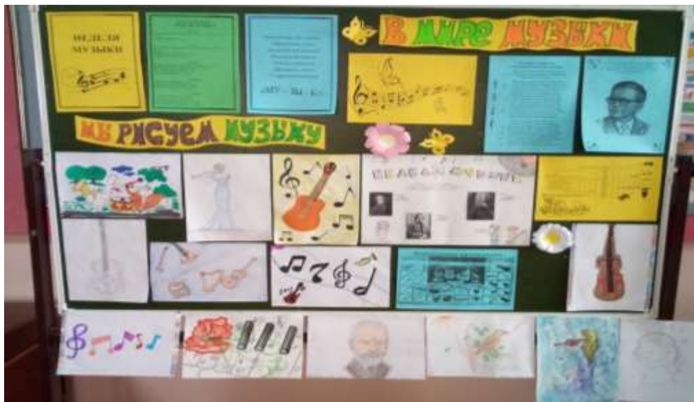
Выставка газет «В мире музыки»